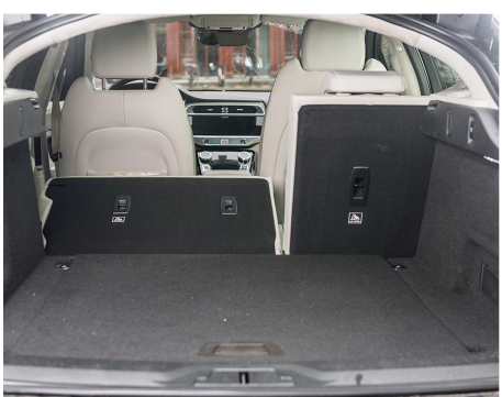
Il volume del bagagliaio è un po' ridotto.