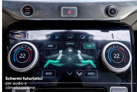
Schermi futuristici per audio e climatizzazione.