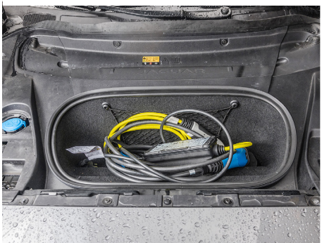
Il vano anteriore per il cavo di ricarica.