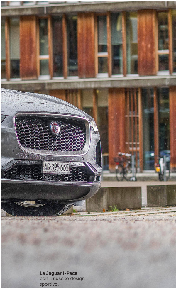
La Jaguar I-Pace con il riuscito design sportivo.