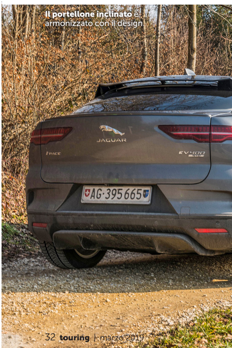
Il portellone inclinato è armonizzato con il design