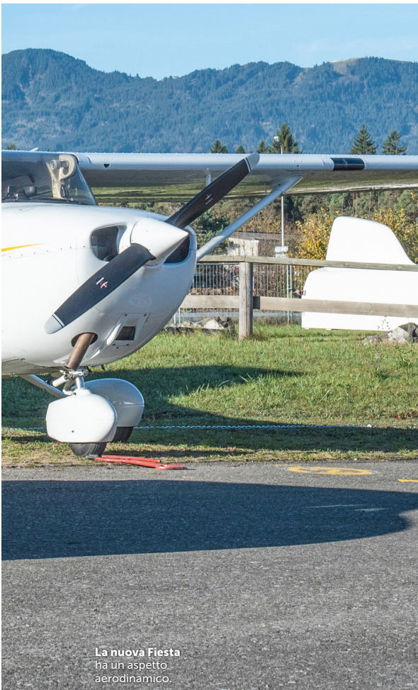
La nuova Fiesta ha un aspetto aerodinamico.