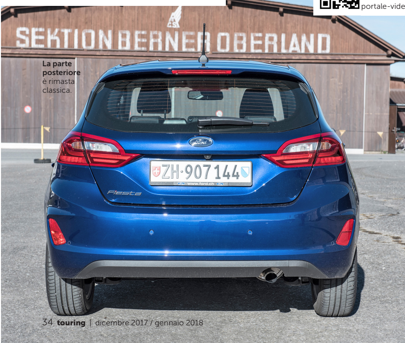
La parte posteriore è rimasta classica.

34 touring | dicembre 2017 / gennaio 2018