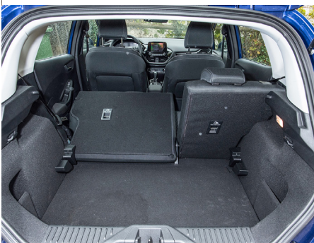
Gli schienali sono ribaltabili e frazionabili.