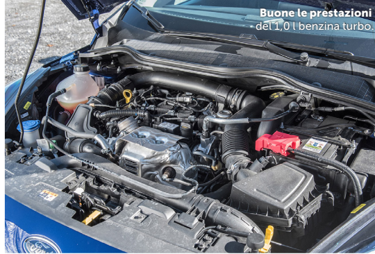
Buone le prestazioni del 1,0 l benzina turbo.