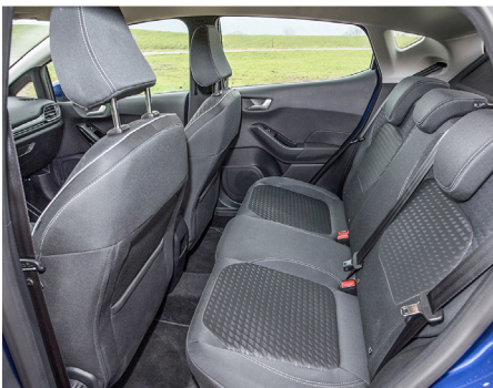
Sul divano lo spazio si riduce.