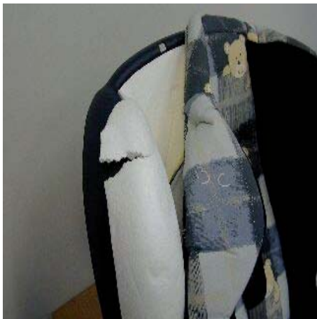
Rottura del seggiolino auto (la fodera è stata rimossa).

In Germania e Austria, è vietato l'utilizzo di seggiolino secondo il regolamento ECR 44.01 e 44.02 dall'aprile 2008. Questo divieto vale anche per tutte le persone svizzere che viaggiano in questi paesi. In Svizzera è ammesso di utilizzare tutti i seggiolini che hanno l'autorizzazione ECE, e questo esiste già dal 1981.