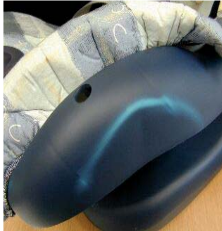
Incrinatura nel cuscino esterno del seggiolino.

Sulla foto qui sotto, il guscio esterno riporta delle incrinature. Questi due seggiolini non dovrebbero più essere usati, indifferentemente dalla loro età!